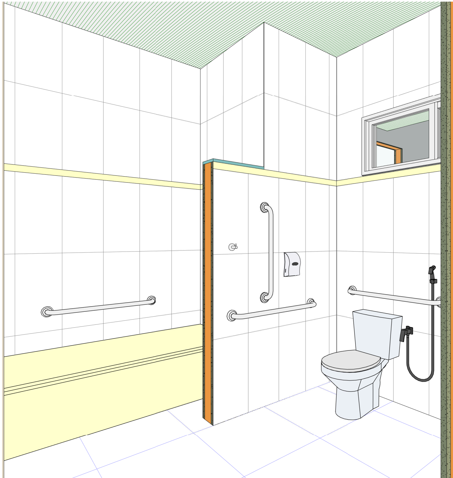
4 PERSPECTIVA 4 escala