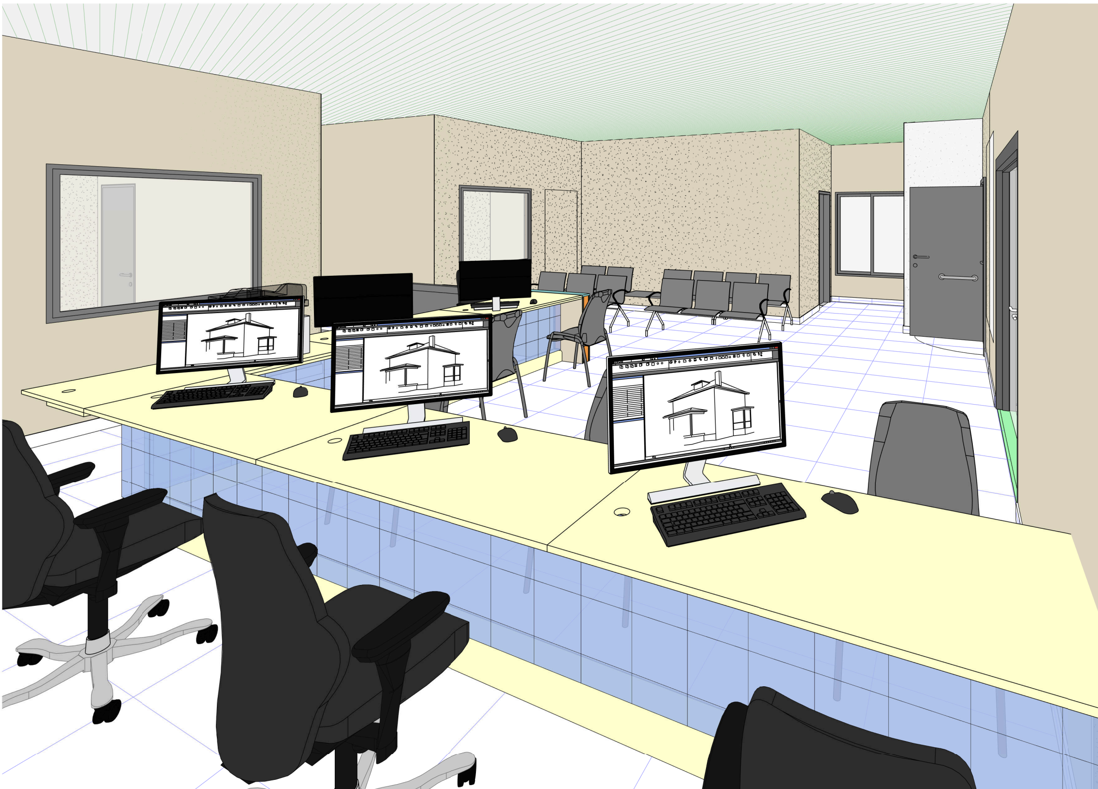
1 PERSPECTIVA 1 escala